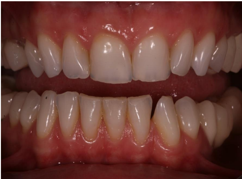
Vorher: Lücken, Abrasionen